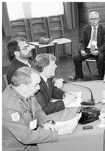
Un momento de la charla. ■ N. A.

Otro dato escalofriante aportado en el encuentro riosellano es que